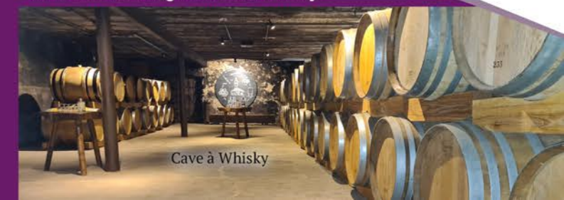
Cave à Whisky

En juillet - août, rendez-vous tous les mercredis à 16h pour une visite guidée de la cave avec dégustation de Whisky.