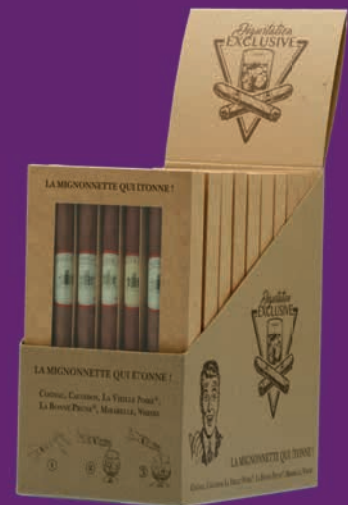
Présentoir de 10 coffrets de 5 cigares

Placez le présentoir sur votre comptoir, près de la caisse... pour un achat Coup de Cœur