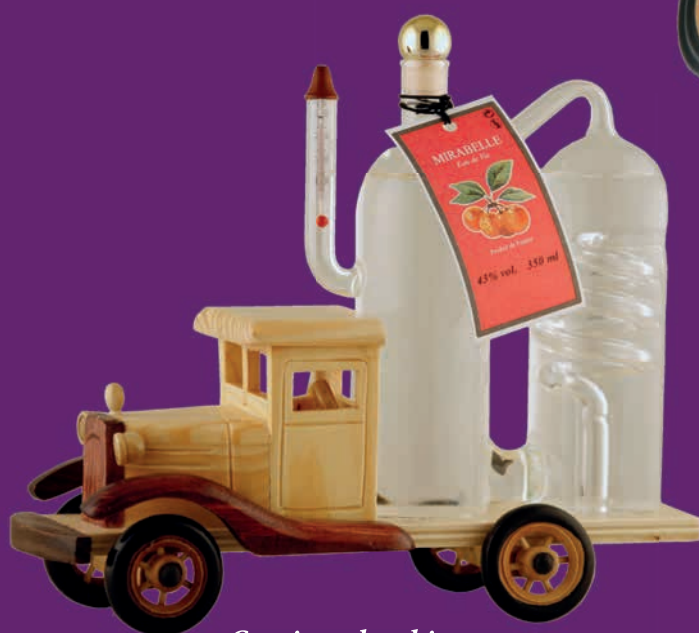
Camion alambic avec eau de vie de Mirabelle