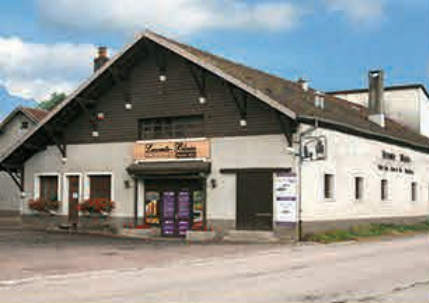
Au cœur des Vosges