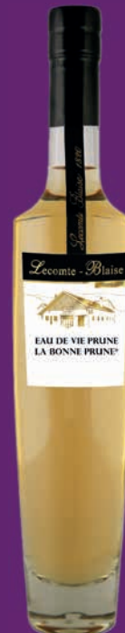
La Bonne Prune® 35cl