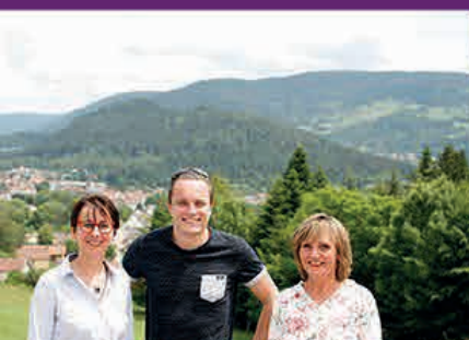
Un accueil chaleureux