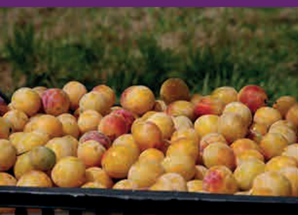
La mirabelle : fruit d'or de la Lorraine