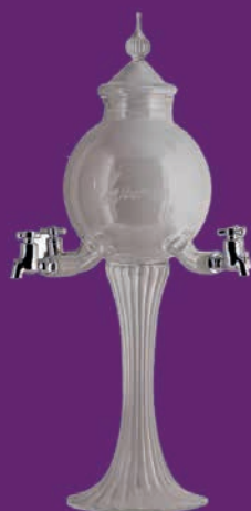
Fontaine 4 robinets Libertine®