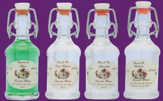
Mignonnettes fermoirs 4cl