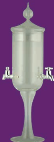
Fontaine 2 robinets