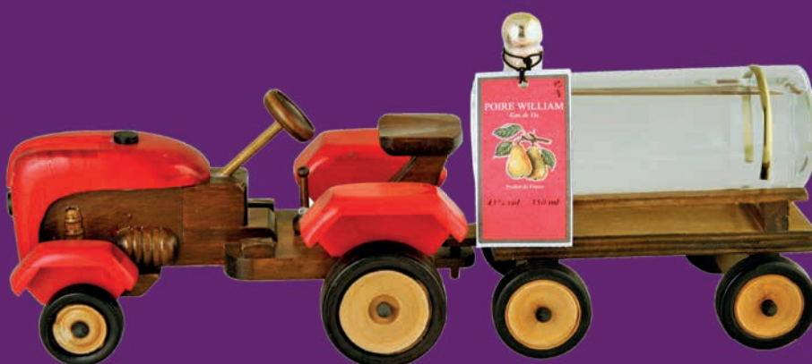
Tracteur avec Eau de Vie de Poire William