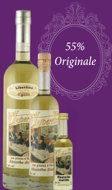
Libertine® 55% en 70cl, 20cl et 5cl