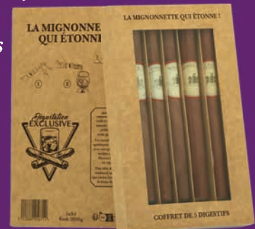
Le coffret de 5 cigares assortis