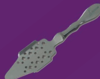
Cuillère à absinthe inox gravée Libertine®