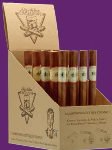
Présentoir pour 20 cigares à l'unité assortis