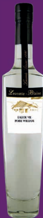
Poire William 35cl