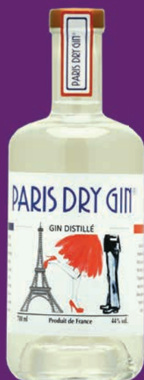
Paris Dry Gin®

Gin aux notes de fleurs et de fruits rouges.