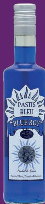
Pastis Blue Roy®

Etonnant et déroutant un pastis « comme à Marseille » élaboré dans les Vosges. Il est de fabrication traditionnelle et artisanale, il a la typicité d'un pastis classique.