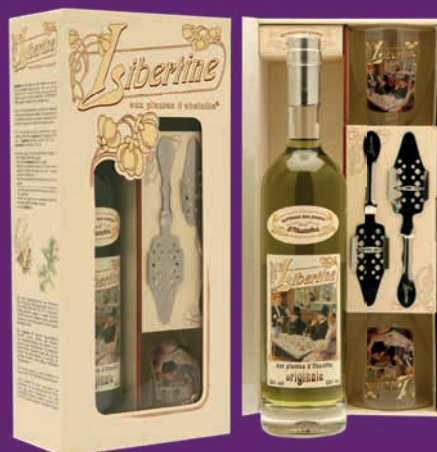
Coffret Libertine® disponible en 55%, 60% et 72%