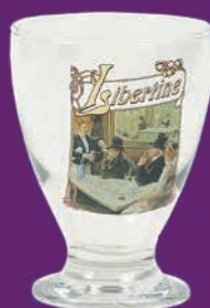
Verre Libertine® sérigraphié