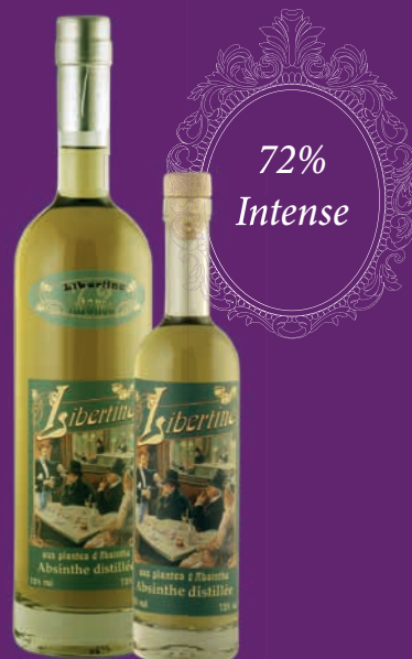
Libertine® 72% en 70cl et 20cl