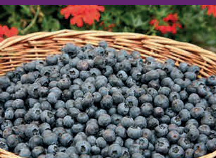
Les bluets des Vosges