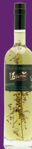
Libertine® 60% Fleur d'Absinthe® avec un brin d'absinthe