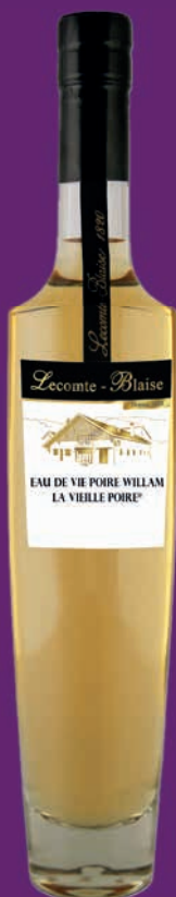
La Vieille Poire® 50cl