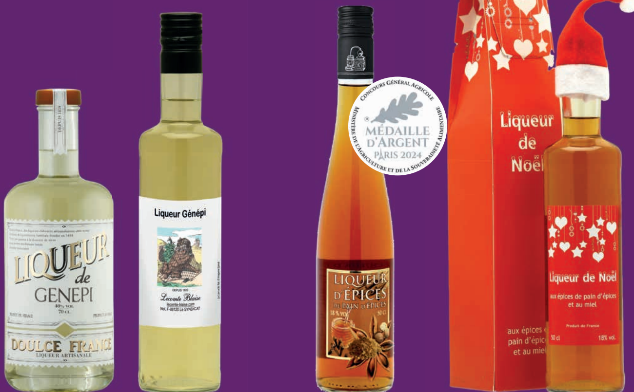
Liqueur de génépi