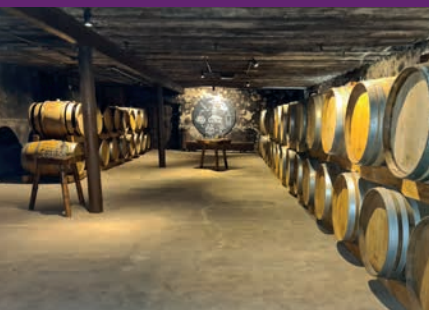
Chais de vieillissement en fûts de chêne