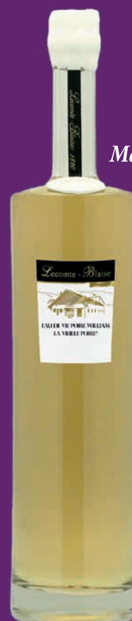
Magnum 150 cl

Délicatement ambrée, la Vieille Poire® allie la richesse de l'eau de vie de Poire William à de subtiles notes boisées