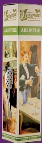
Étui pour gamme Libertine® 70cl + cuillère