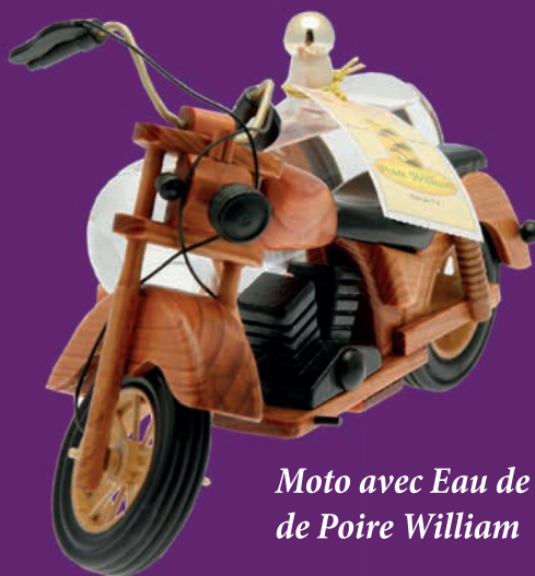
Moto avec Eau de Vie de Poire William