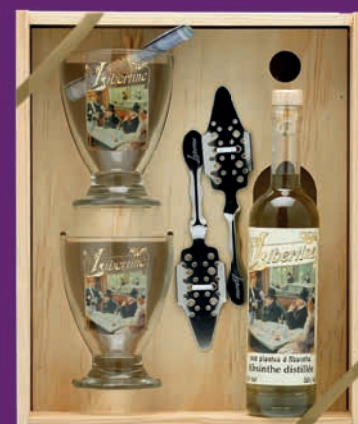
Caisse bois Libertine® 20cl en 55% ou 72%