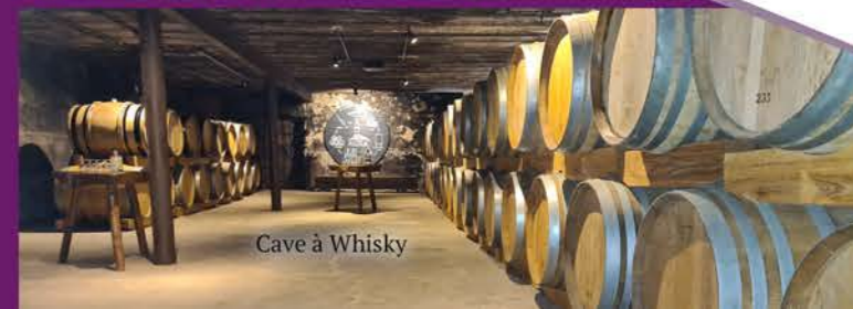
Cave à Whisky

En juillet - août, rendez-vous tous les mercredis à 16h pour une visite guidée de la cave avec dégustation de Whisky.